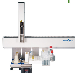
德国PAS CONCEPT MIS 气相色谱多功能自动进样器