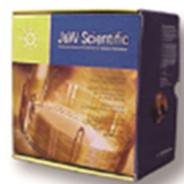
美国Agilent 气液相色谱耗材