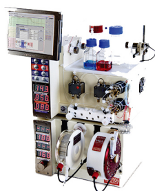
英国Vapourtec 流动合成仪R系列