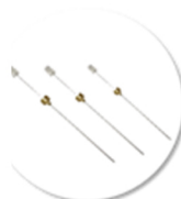
英诺德INNTEG Fiber-SPME 固相微萃取探针