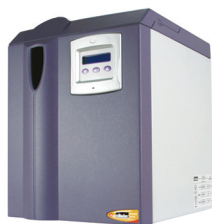
英国Parker domnick hunter 高纯氢气/氮气发生器