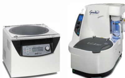
英国GeneVac 溶剂蒸发工作站