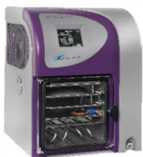
美国SP SCIENTIFIC 桌上研发型冻干机