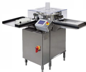
美国PennTech 制药洗烘灌设备