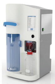
意大利 Velp 凯氏/杜马斯定氮仪