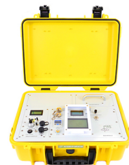
德国PAS 动态针捕集自动采样器

PICKERING LABORATORIES CATALYST FOR SUCCESS