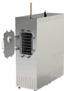
美国SP SCIENTIFIC 小试生产型冻干机