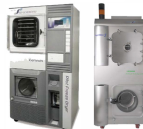
美国SP SCIENTIFIC 中试研发型冻干机