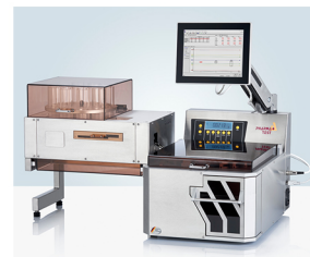
德国Pharma-test 全自动片剂测试系统