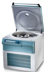
德国 Hettich 离心机系列