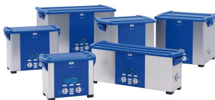
德国 Elma 超声波清洗器