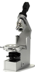
英国BioPharma Technology LyoStat5冻干显微镜