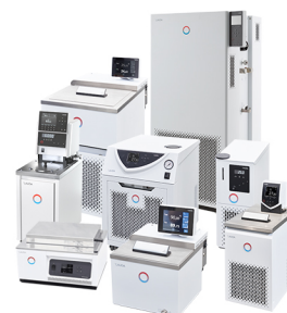
德国 Lauda 水浴温控设备