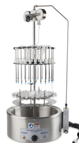
美国 Organomation 氮吹浓缩仪