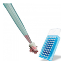
美国SP Bel-Art Flowmi 细胞过滤器