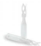
英诺德INNTEG 通用色谱耗材