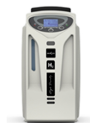
英诺德INNTEG 氢气发生器