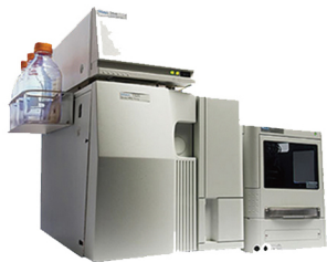
美国Waters Breeze™ QS HPLC