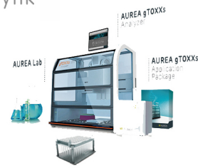
德国3T 全自动DNA损伤分析仪