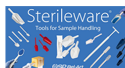
美国SP Bel-Art Sterileware 取样工具