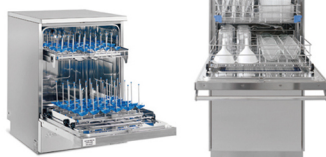
意大利 Steelco 全自动清洗消毒机