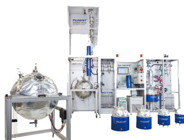
德国Pilodist PD 400CC全自动实沸点蒸馏系统