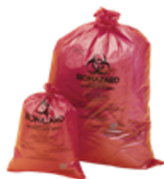
美国SP Scienceware 生物危害样品垃圾袋