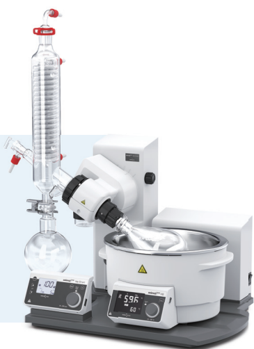
Innoteg-ScienceOne Vap Smart 旋转蒸发仪