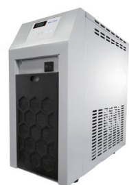
Innoteg TCS-3 循环水浴