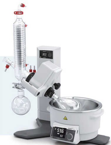
Innoteg-ScienceOne Vap Basic 旋转蒸发仪