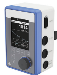
数字化真空控制器