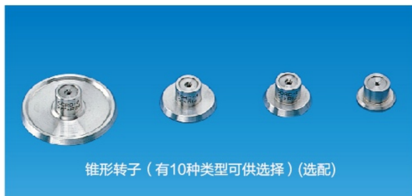
锥形转子（有10种类型可供选择）（选配）