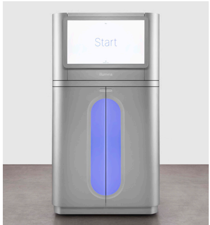
图 1: NovaSeq X 和 NovaSeq X Plus 测序系统——Illumina 的创新持续扩大高通量基因组学技术的可及性，促进科学新见解的产生。