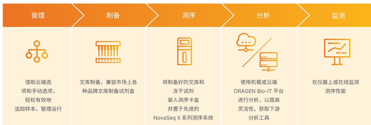
图 4：直观、优化的高通量测序工作流程——NovaSeq X 和 NovaSeq X Plus 测序系统提供了一个全面的工作流程，包括对用户友好的运行设置、广泛的文库制备试剂盒兼容性和集成二级分析等性能。