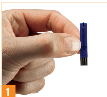
1 取出试纸片， 按箭头方向向下插入仪器