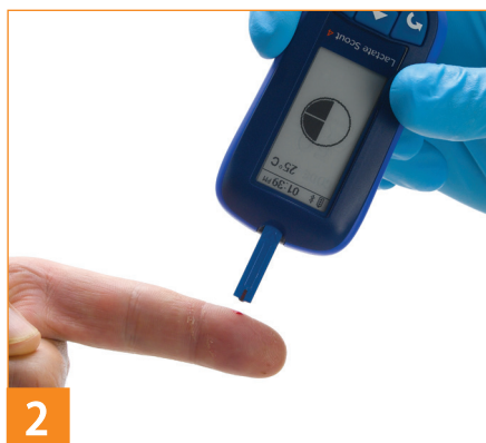
2 穿刺采血 将试纸片吸血区域充满