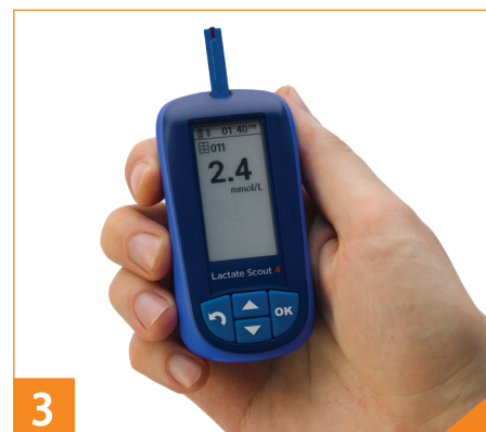
3 10秒后，即可测出结果