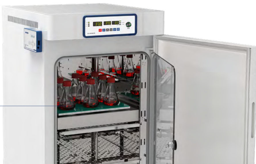
CO 2 箱内振荡培养