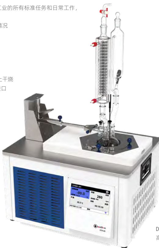
DTR 专家型 高低温搅拌反应装置