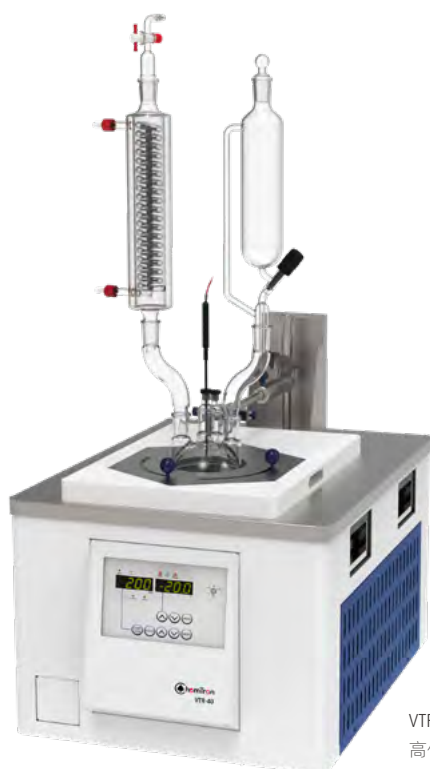
VTR 标准型 高低温搅拌反应装置