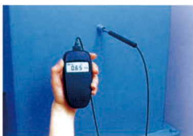
管道内的风量测试