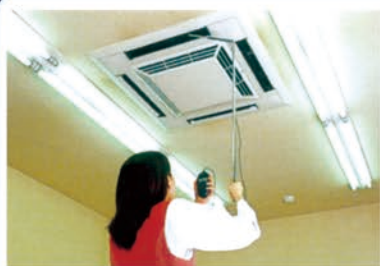
空调等风量的检查 (延长棒为选择件)