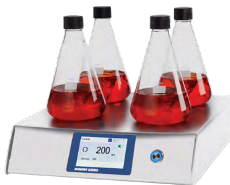
四位 Micro-Stir 搅拌器