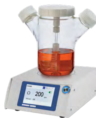
一位 BioStir 搅拌器