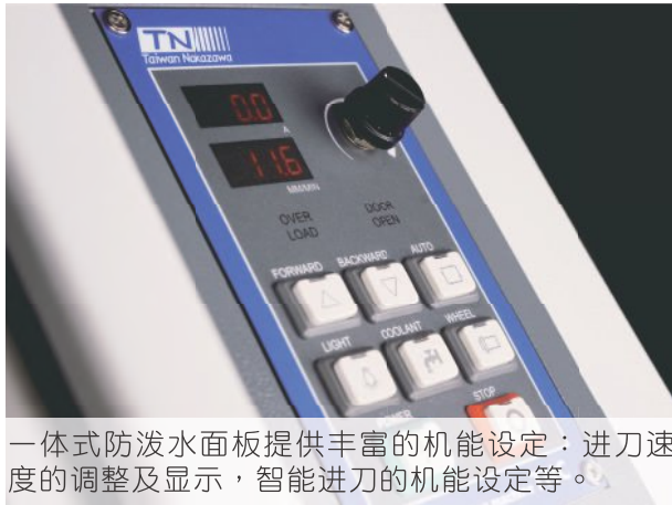
一体式防泼水面板提供丰富的机能设定：进刀速度的调整及显示，智能进刀的机能设定等。