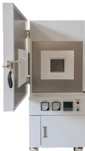
立式箱式电炉为 1600°C和 1700°C