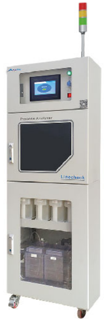
酸碱度在线分析仪