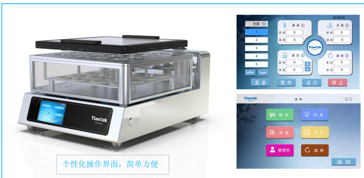
个性化操作界面，简单方便

真空平行浓缩仪可对多个样品进行单独或者集中密闭蒸发/浓缩，快速有效的回收溶剂，降低了多个样品的总蒸发时间，增加了处理量，节省了操作实验时间和实验资源，平行蒸发仪安装操作简单、使用灵活。由于处理条件高度一致，因此平行性也更好。平行蒸发仪主要用于化工、医药、生物、环保、检测或其它行业中样品的蒸发浓缩。