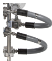
夹套进出口多通道阀, 进口压力可调用于保护玻璃夹套, 便于更换温控单元或导热介质