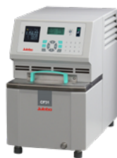
JULABO CF31 动态温度控制系统