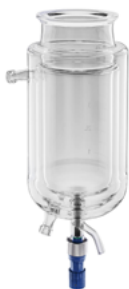
带真空保温层的三层夹套反应釜, 低温至 -80°C