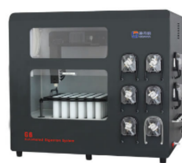
G6全自动石墨消解仪（36位）

适用于火焰原子吸收光谱仪，原子荧光光谱仪，ICP光谱仪，ICP-MS，极谱仪，测汞仪，化学分析法等