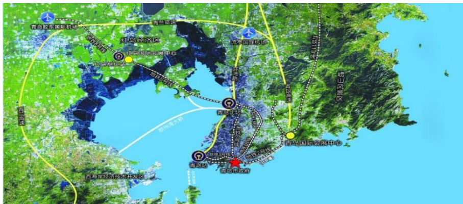
(二) 年会展会布局图 (青岛国际会展中心·2号馆)