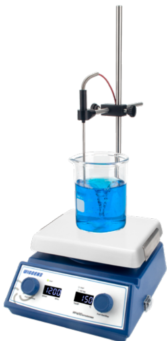
实验室通用型加热混合设备