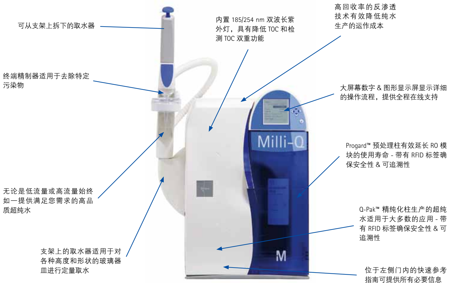
Milli-Q™ Direct 系统内部原理图