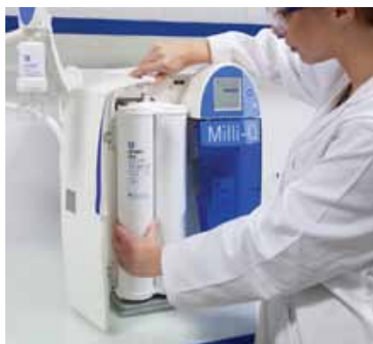
更换 Q-Pak™ 精纯化柱