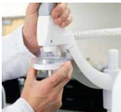
更换 Millipak™ 终端过滤器

Merck Millipore 的服务项目涵盖您所有的维护需求，如系统安装、定制化用户培训、科研及技术支持、故障排除、预防性维护拜访等，对客户在 GxPs 环境下的验证需求我们还可以通过专门校准设备、程序、工作手册和适用性测试来实现。