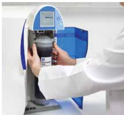
更换 Progard™ 预处理柱