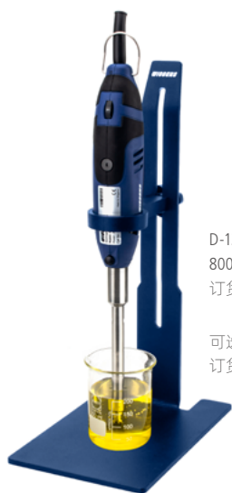
D-130 8000 ~ 30000rpm 订货号: 1710130