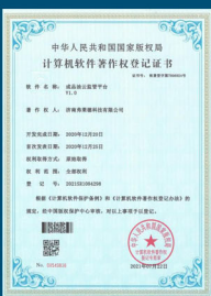
成品油云监管平台