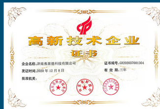
高新技术企业证书