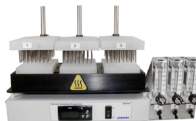
3 位 96 孔板氮吹仪