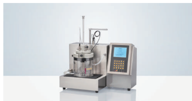
SPT-6 栓剂软化(渗透)时间测试仪

欧洲药典描述了测试栓剂的崩解时间和软化时间的方法, 通过将样品放入加热水浴内的旋转篮中来测量崩解时间, 软化时间是栓剂在一定温度下熔化的时间, 用于测试栓剂崩解和软化时间的这一系列仪器包括崩解仪和栓剂渗透测试仪。