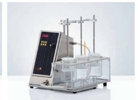
PTZ-S & DIST 手动崩解仪