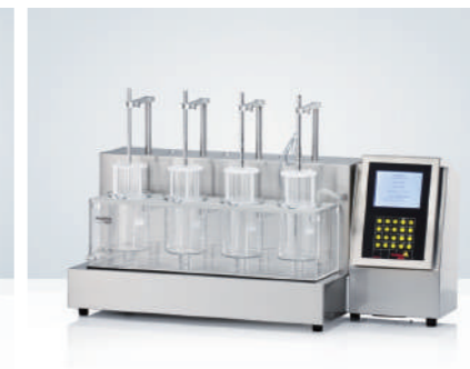
PTZ AUTO 半自动崩解仪