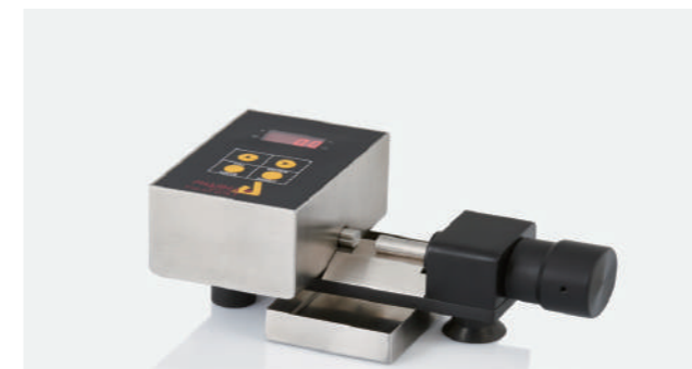
PTB-M 便携式药片硬度测试仪