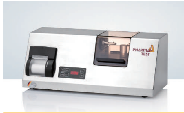
PTB 302 药片硬度测试仪

测量参数: 厚度, 直径 (长度), 硬度和质量 测量模式: 恒力法, 恒速法 硬度测量范围: 5-500N(10-1000N可选) 硬度单位:N, Kp, Sc 厚度测量范围: 2-12mm 直径测量范围: 2-30mm 片重: 可连Mettler或Satorius分析天平 接口: RS232, USB, LAN接口 全身不锈钢机身; 标配IQ和OQ文件