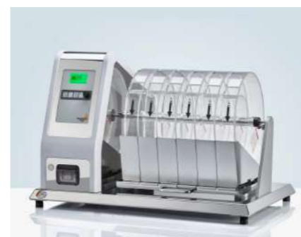
PTF 300 / PTF 600 脆碎度测试仪

易碎性测试用于测试包装过程和运输过程中片剂的耐久性。这包括使用带挡板的旋转滚筒在固定时间内重复掉落片剂样品。检查结果是否有破碎的片剂, 以及片剂质量通过碎片损失的百分比。所有Pharma Test脆碎度测试仪完全符合当前的USP和EP 药典标准, 并附带标准供货范围内的易碎性(“Roche”)鼓。可提供磨损鼓和防静电涂层。所有PTF仪器均支持10度角操作, 通过使用可折叠支脚测试较大样品。