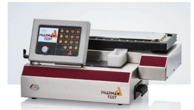
PTB 420 Auto 4合1药品硬度测试仪

测量参数:厚度,直径(长度)和硬度 测量模式:恒力法,恒速法 硬度测量范围:5-300N(500N,800N可选) 精度:1N 硬度单位:N,Kp,Sc 接口:RS232接口,外接打印机 打印机:可连Dot-Matrix或PCL5打印机 全身不锈钢机身 标配IQ和OQ文件