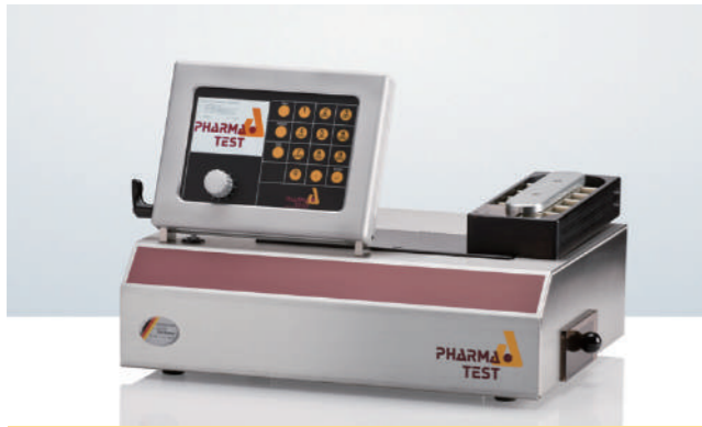
PTB 420 4合1硬度测试仪