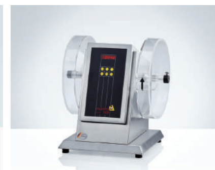
PTF 10E / PTF 20E 脆碎度测试仪