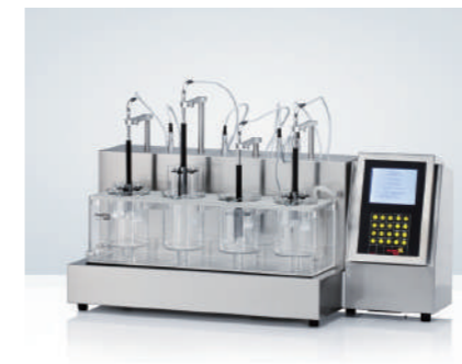
PTZ AUTO EZ 全自动崩解仪

片剂崩解测试仪器广泛用于制药工业中,用来评价制剂的崩解特性和不同剂型的质量控制。所有Pharma Test片剂和胶囊崩解测试仪完全符合当前的USP和EP药典,并支持A型和B型篮用于常规或更大样品。PT-ODF(如上图所示)是一种用于测试口腔可分散薄膜崩解的特殊篮子。