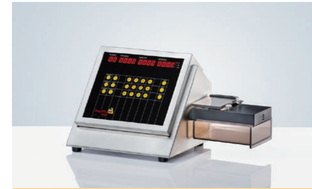
PTB 111E 药片硬度测试仪

可测量任意形状片剂的硬度 可测量片剂直径范围0-40mm (70mm可选) 测量原理: 恒力法 硬度测量范围: 5-300N 精度: 1N 硬度单位:N, Kp, Sc 打印机: 内置热敏打印机 接口: RS232 标配IQ和OQ文件