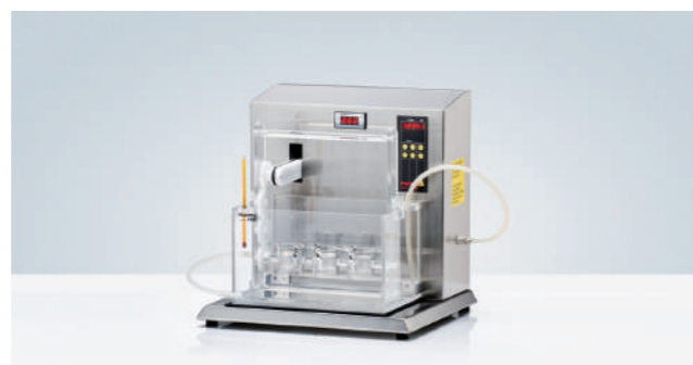
PTS 3E 栓剂测试仪