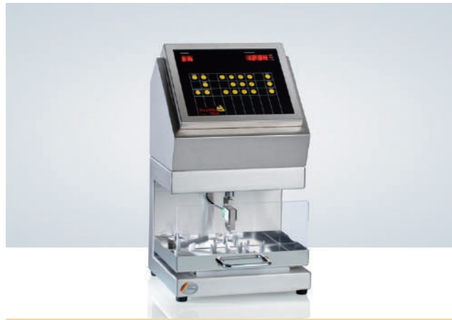
PTBA 211E 安瓿瓶断点测试仪