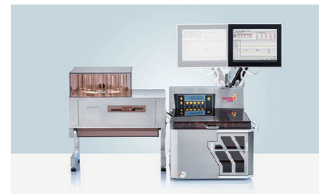
WHT 4 全自动4合1片剂测试系统