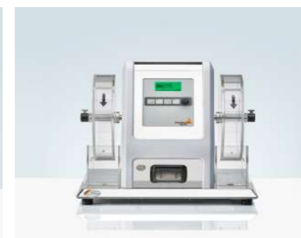
PTF 100 / PTF 200 脆碎度测试仪