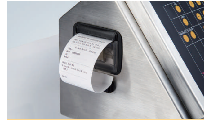
PTB 111EP 药片硬度测试仪

显示器: LED显示测试数量和硬度结果 测量模式: 恒力法, 恒速法 硬度测量范围: 5-300N (500N, 800N可选) 分辨率: 0.1N 精度: 1N 硬度单位: N, kp, Sc 接口: RS232 打印机: 可连Dot-Matrix或PCL5打印机 全身不锈钢机身 标配IQ和OQ文件