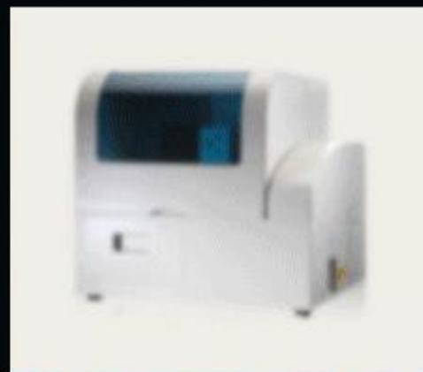
生化仪、纳米喷镀设备用