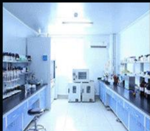
科研院校 新型材料实验室