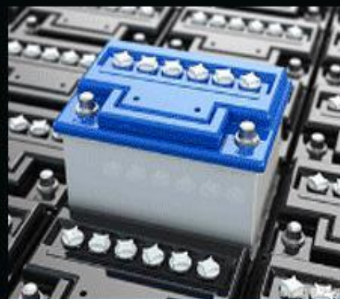
电池、电瓶制造创新维护保养