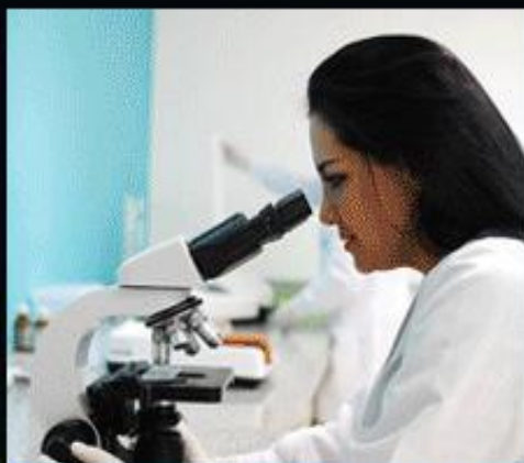
医疗 化验 分析检验室