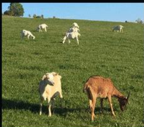
科学养殖场 植物研究分析培养