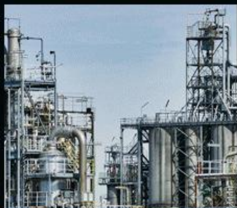
水处理工厂 化工厂 企业单位