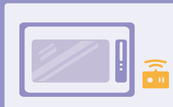
开合接触报警系统