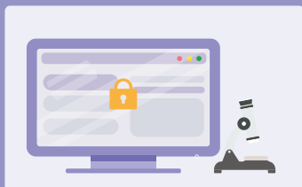
电脑解锁屏软件系统