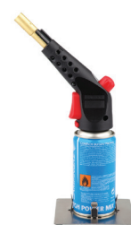
固定底座 订货号 : 6.000.816