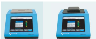
InfraCal 2 ATR-SP