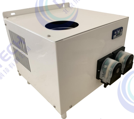
微型壁挂/台式冷凝器