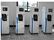
在线柜式水质监测仪 COD、氨氮、总磷、总氮