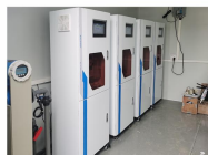
在线柜式水质监测仪 COD、氨氮、总磷、总氮