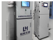
LH-G8901 余氯、浊度、pH、电导率、温度