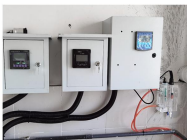
LH-DG150, LH-YB08 LH-DO530, LH-DL05