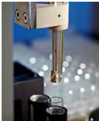
Five miniature probes entering sample vial

SiriusT3 作为全球理化常数测定的"黄金标准",广泛用于全球各大生物化学机构,CRO公司,是新药研发不可或缺的辅助工具。