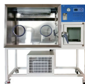
HYQX-III-Z 制冷型厌氧培养箱