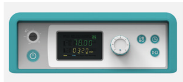
更大更清晰的高清VFD控制器,直观显示机器运转信息。