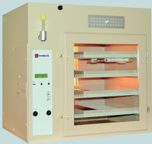
BSS160 ( 货号8104 )