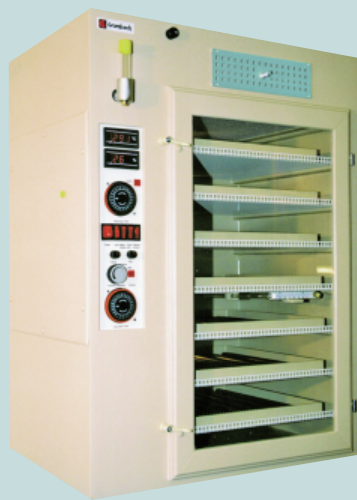
BSS300 ( 货号8203/01/02 )