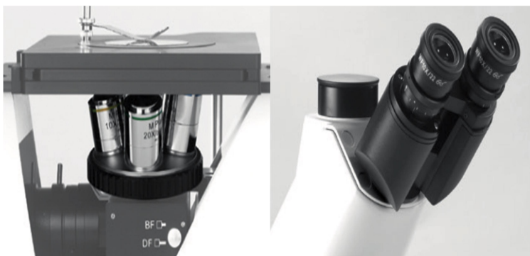
可实现明暗场观察功能