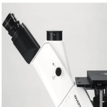
两档转换式观察筒:100%观察;20%观察,同时80%摄影