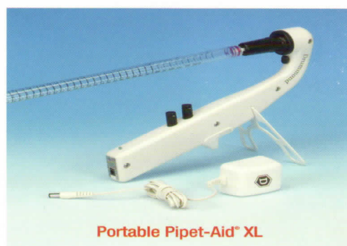
Portable Pipet-Aid® XL