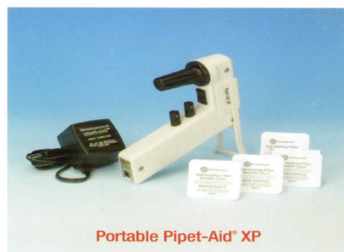
Portable Pipet-Aid® XP