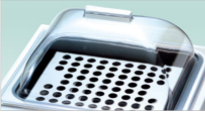
透明聚丙烯山形顶盖