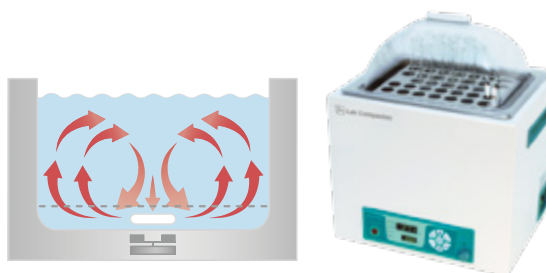
通过搅拌子循环浴液