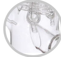
独特设计有滴液点, 防倒流装置