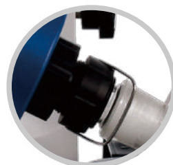
专用螺纹退瓶组件