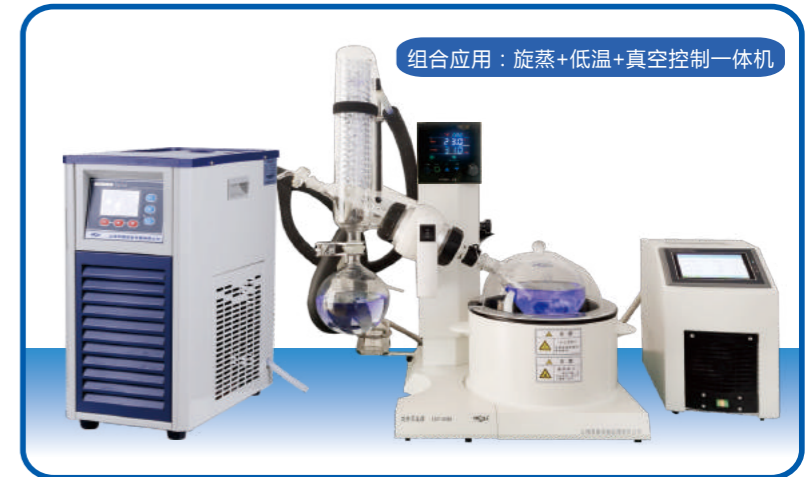
组合应用：旋蒸+低温+真空控制一体机