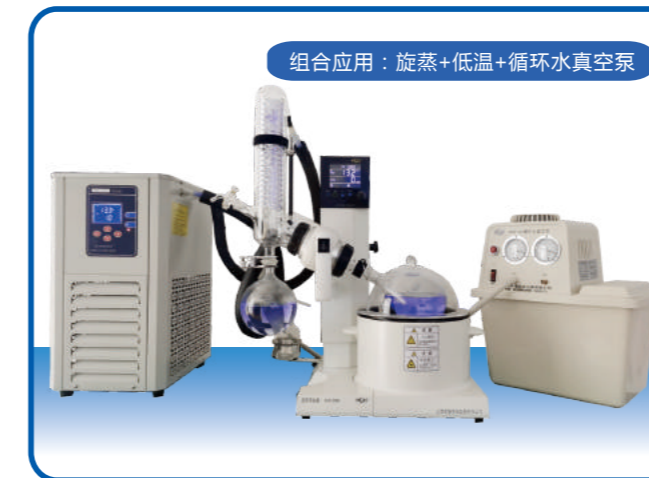
组合应用：旋蒸+低温+循环水真空泵