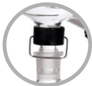
(可选)B型标准磨口冷凝管+锁瓶器