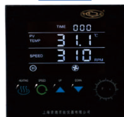
大液晶屏,多数据一体集成式