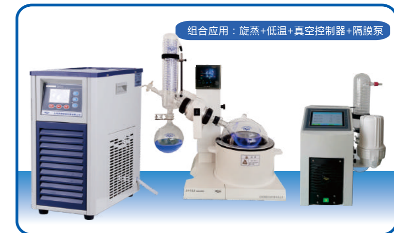
组合应用：旋蒸+低温+真空控制器+隔膜泵