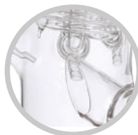
独特设计有滴液点,防倒流装置 专利号: 201922023831.1