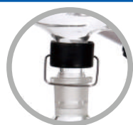
(可选)B型标准磨口冷凝管+锁瓶器