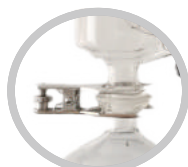
(标配)A型球磨口冷凝管+球形夹