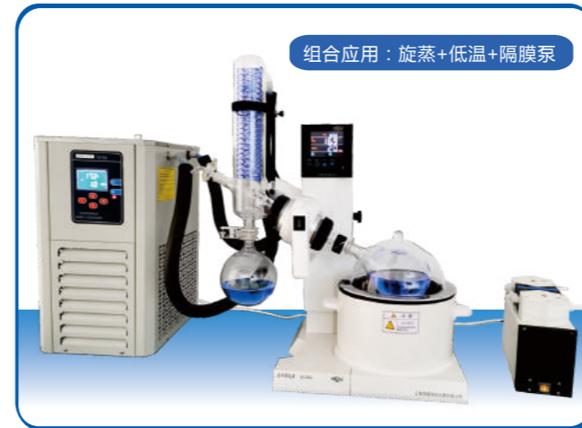
组合应用：旋蒸+低温+隔膜泵