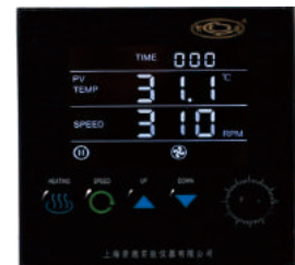
大液晶屏,多数据一体集成式