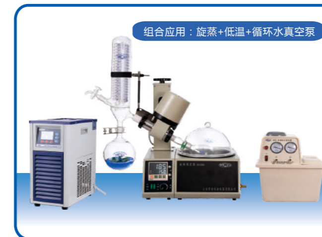
组合应用：旋蒸+低温+循环水真空泵