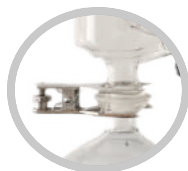
(标配)A型球磨口冷凝管+球形夹