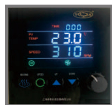
大液晶彩屏,多数据一体集成式