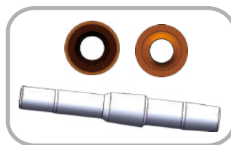
玻璃转轴，密封组件