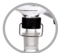
(可选)B型标准磨口冷凝管+锁瓶器