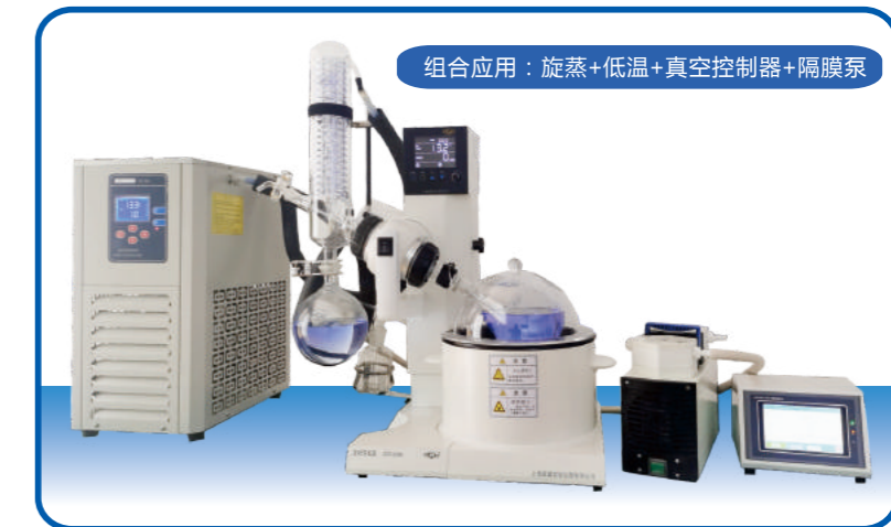
组合应用：旋蒸+低温+真空控制器+隔膜泵