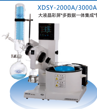
XDSY-2000A/3000A/5000A 大液晶彩屏*多数据一体集成*智能化升级