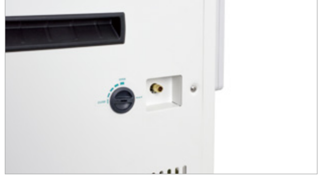
侧面的球阀式废水阀，简单方便排出浴液。