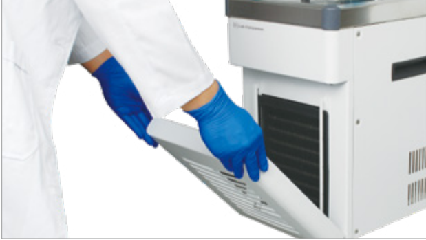
无需其它额外工具即可拆卸冷凝器滤网保护罩。