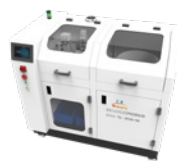
智能废液回收系统