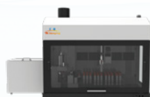
智能配液加盖系统