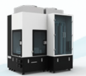
智能微生物培养制备系统