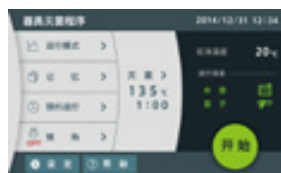
灭菌参数设置 (器具灭菌程序)