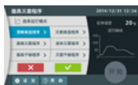
运行模式选择 (溶解保温程序)