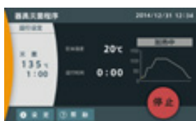
运行状态监视 (器具灭菌程序)