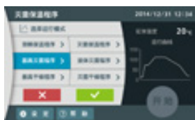
运行模式选择 (器具灭菌程序)