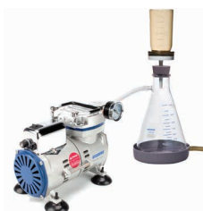
真空抽滤应用 选型详见 P20