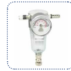
真空调压过滤器净化进气