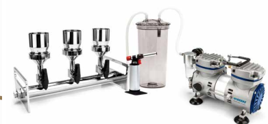
多联真空抽滤应用 选型详见 P25