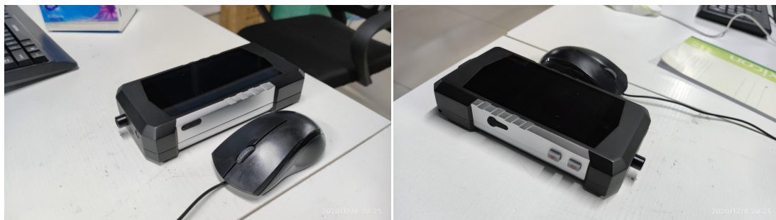
图 1 ATR6600Pro 实物图