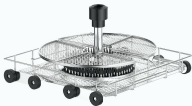
XCJY230 下层 230 位注射式清洗篮架