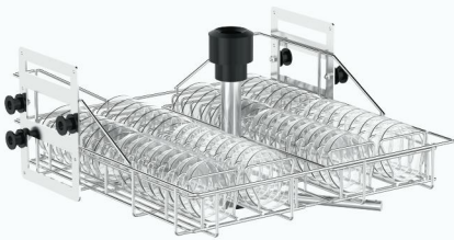
SCYP60 上层 60 位培养皿清洗篮架