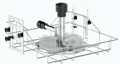
SCJY230 上层 230 位注射式清洗篮架