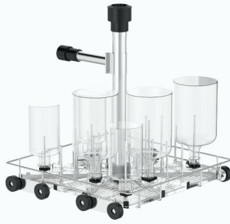
DCYT52 单层 52 位注射式清洗篮架