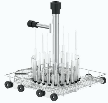
XY172 单层 172 位注射式清洗篮架