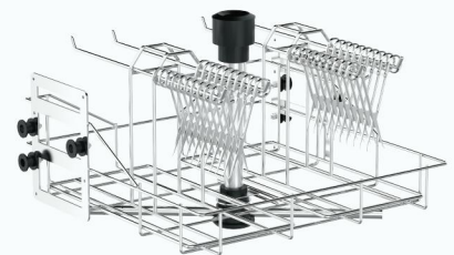
SCGK 43 上层 医用清洗篮架