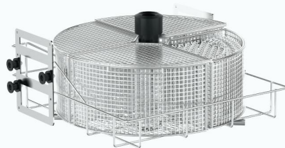
SCGK 40 上层 XCGK 40 下层清洗篮架