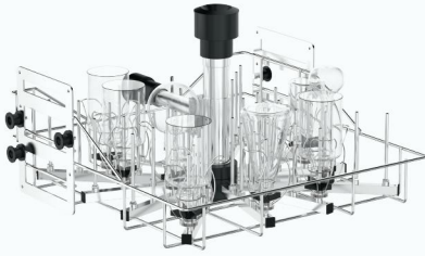
SCYT52 上层 52 位注射式清洗篮架