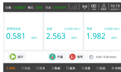
嵌入式数据工作站