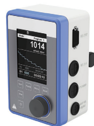
数字化真空控制器