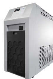
Innoteg TCS-3 循环水浴