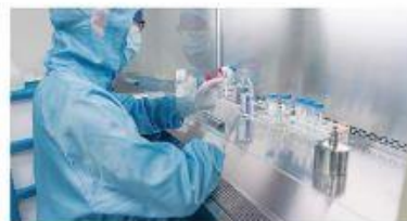
提供各类空间消毒服务