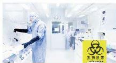
生物安全实验室/SPF实验动物房