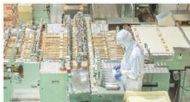
食品加工厂生产各环节消毒