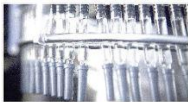
无菌制药洁净生产区/检验区