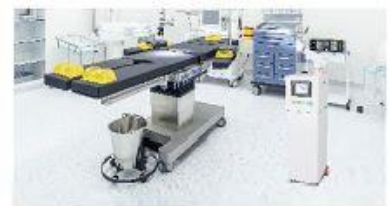
医院病房/手术室/感染科/急救车