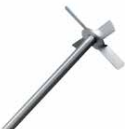
螺旋桨型 4 叶片