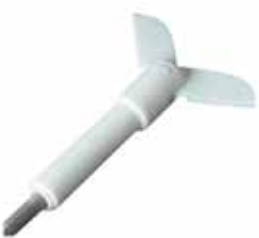
离心型 PTFE 涂层双叶片