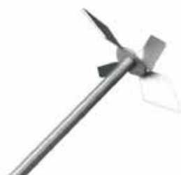
钻石型 4 叶片