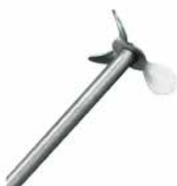
螺旋桨型 3 叶片