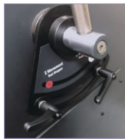
切割电机位置固定装置