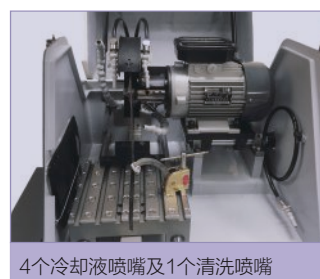
4个冷却液喷嘴及1个清洗喷嘴