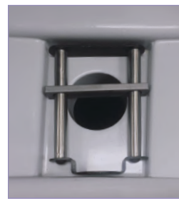
配有磁性碎屑收集装置的排水口