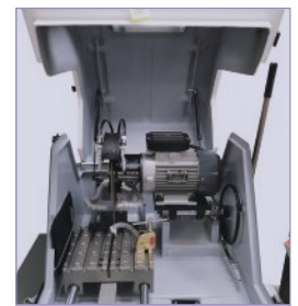
切割室防腐涂层处理