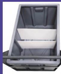
第二级、第三级过滤板