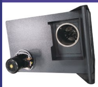
三级过滤的循环水箱入水口