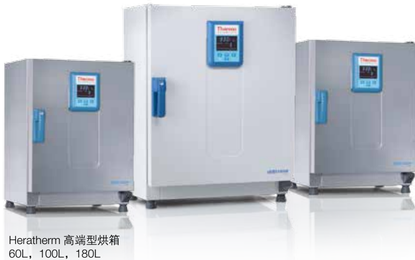
Heratherm 高端型烘箱 60L, 100L, 180L

Thermo Scientific Heratherm 高端型号包括了通用型烘箱的所有优点,同时还提供了其他附加功能,具有更大的灵活性、准确性和可靠性。