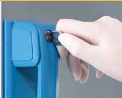
加锁门限制任意拿取样本