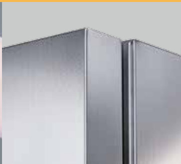
不锈钢外形可满足药品和 临床实验室的要求