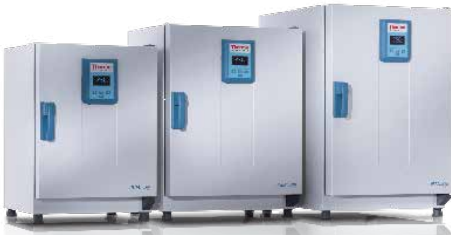
Heratherm 通用型烘箱 60L, 100L, 180L

Thermo Scientific Heratherm 通用型烘箱最适合于常规的日常工作，为您的应用提供了理想的加热和干燥解决方案。