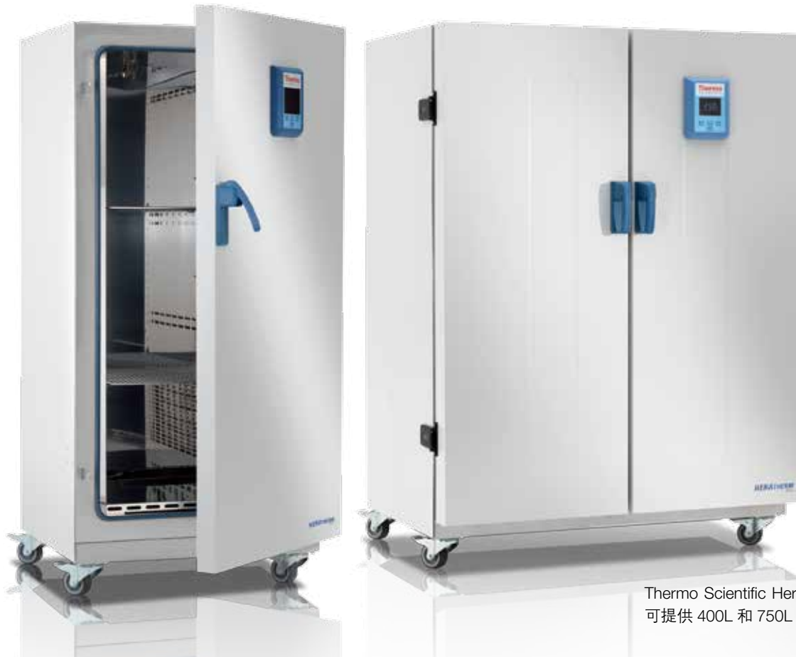
Thermo Scientific Heratherm 大容量 可提供 400L 和 750L 的烘箱

Thermo Scientific Heratherm 大容量通用型烘箱专为大型样品或大体积样品而设计。通用型烘箱容量大，可满足您的日常干燥与加热应用。