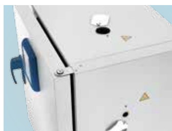
顶部接入口和右侧接入口

请订购我们的专门解决方案。我们可提供用于电缆试验和洁净室的 Heratherm 台式烘箱，以及用于惰性气体应用的气密性内壳。对于大容量烘箱，我们可根据您的应用要求在您指定的位置设置附加接入口。