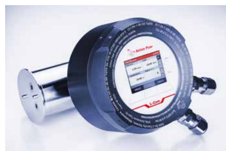
L-Com 5000 Ex 版本是防爆版本,专门设计用于在危险环境中测量易燃液体。

在相同的在线介质条件下只需一个测量周期即可确定密度和声速值。精度水平无与伦比,密度精度可以达到 5 \times 10^{-5} \text{ g/cm}^3 ,声速精度达到 0.1 m/s。各种工艺连接和电气接口适合饮料或化工行业应用。