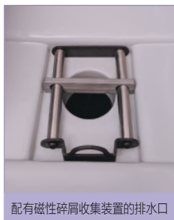
配有磁性碎屑收集装置的排水口