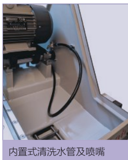
内置式清洗水管及喷嘴