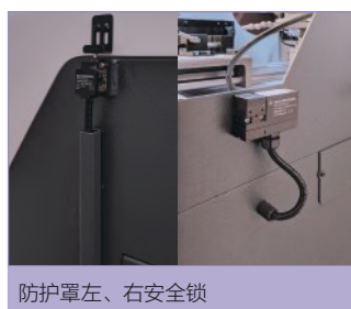
防护罩左、右安全锁