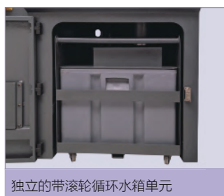
独立的带滚轮循环水箱单元