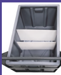
第二级、第三级过滤板