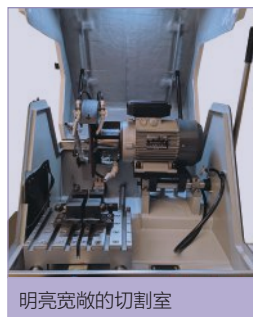
明亮宽敞的切割室