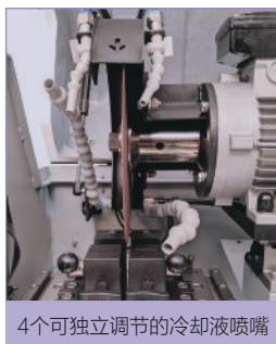
4个可独立调节的冷却液喷嘴